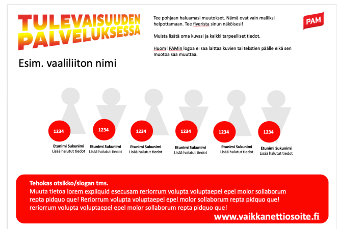
PP-suunnittelupohja, A4, useampi ehdokas