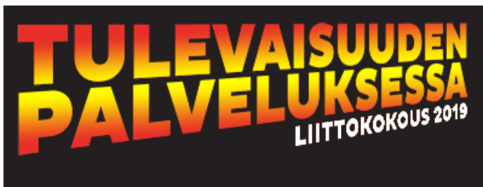
Tulevaisuuden palveluksessa -logo