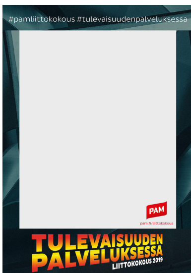
png-kuva, johon voit liittää kuvasi (esim. someen)