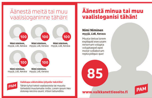
PP-suunnittelupohja, A4, jossa kaksi A5-mainosta